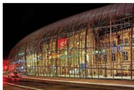
Hauptbahnhof Straßburg: Umhüllt von kaltgebogenem Glas gewährt die Fassade dem Betrachter Durchsicht auf das historische Gebäude.