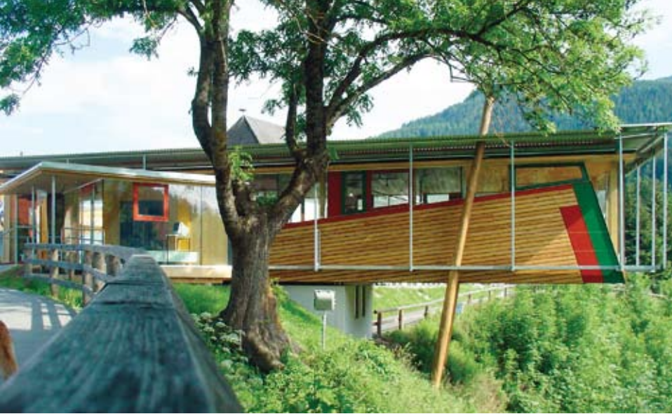
Der konstruktive Holzbau mit Glas- und Stahlelementen ragt über die Böschung des ehemaligen Ranten-Ufers.