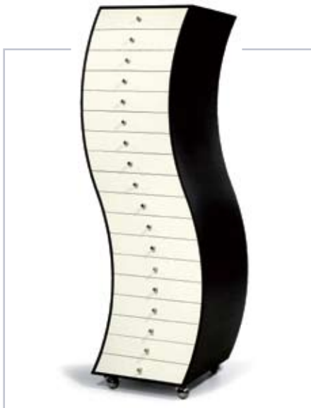
Wohntrends zum Wohlfühlen auf den Seiten 14+15.