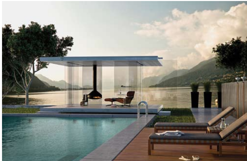
Ohne Streben, ohne Pfeiler: Der „Pavillon 360“ aus selbsttragenden Glaswandscheiben als elegantes Gartenelement.

Glas ist aus moderner Architektur nicht wegzudenken. Gerade bei Großprojekten bedienen sich Architekten des Baustoffs wie der Schneider des Zwirns. Bislang wurde das Material bezogen auf Funktionen, die über die Beschaffenheit der Transparenz hinausgehen, eher ideenkarg und als notgedrungener Lichteinlass in Gebäuden behandelt. Oft resultieren daraus ein hoher Wärmeverlust im Winter oder umgekehrt immense Klimatisierungskosten der Innenräume im Sommer. Mehr und mehr wird diesen Problemen mit kreativen Lösungen begegnet. Eine Menge an innovativen Glasproduzenten bemüht sich dem Material