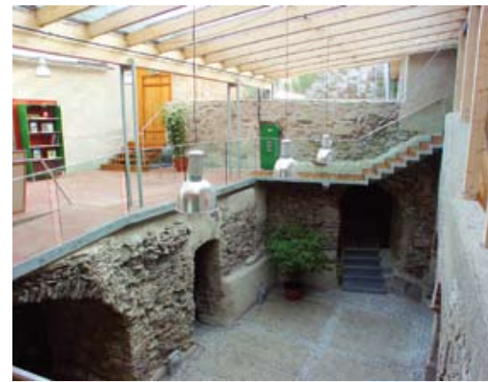
Das Rathaus von Murau wurde in einen Altbau integriert.

zepten so gut es geht mit eingebunden. Denn: „Das Produkt Holz steht mit seiner Festigkeit fertig im Wald und weist fantastische Eigenschaften auf.“ Zudem strahlt das individuell gewachsene Holz eine unnachahmliche Lebendigkeit aus, an die industriell gefertigte Materialien nicht heranreichen. „Bei Kombination von Holz mit modernen Elementen aus Glas oder Stahl ergibt sich eine eigene Spannung, die das Holz noch mehr zur Geltung bringt“, meint Paschek, dessen Büro holziger nicht sein könnte. Spezialisiert hat sich die „Bau:Kultur:GmbH“ zudem auf die Erhaltung und Revitalisierung von vorhandener Bausubstanz. Der Baubestand, seine Geschichte, der technische Zustand und die Qualität sind bei Renovierungen die entscheidenden Faktoren. „Die Erhaltung alter Bausubstanz setzt eine weitreichende Kenntnis historischer Bauweisen und alter Handwerkstechniken voraus“, erklärt Paschek, der dieses Wissen durch langjährige Erfahrung und den Vergleich unterschiedlicher Projekte gewonnen hat. Vor allem in der Beurteilung des vorhandenen Bauzustandes sei diese Erfahrung unerlässlich, fußt auf ihr doch der gesamte weitere Projektlauf. Das Team