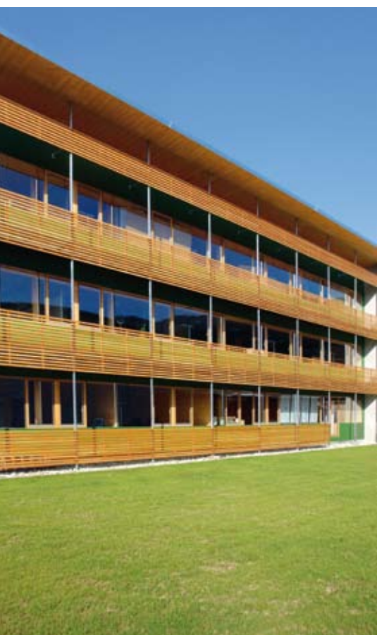
Das KLH-Bürogebäude in Frojach/Katsch.