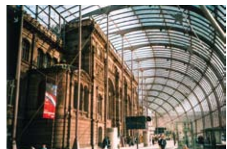
Rund 6.000 Quadratmeter Glas wurden bei der Neugestaltung des Straßburger Hauptbahnhofs verwendet.