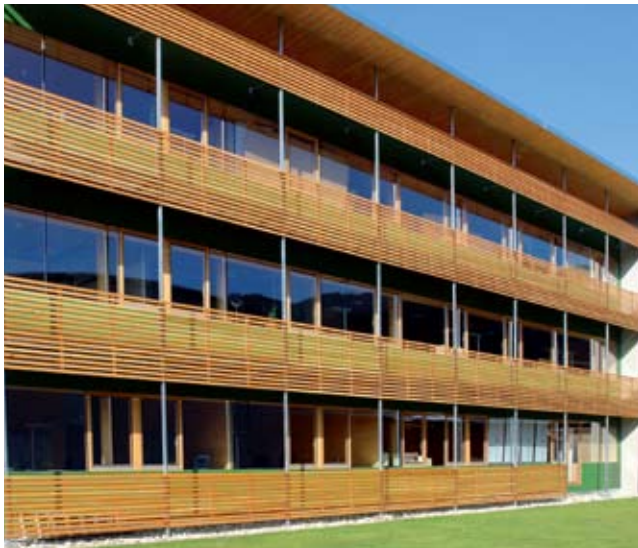
Murauer Holzbau-Kultur Seiten 12 + 13.